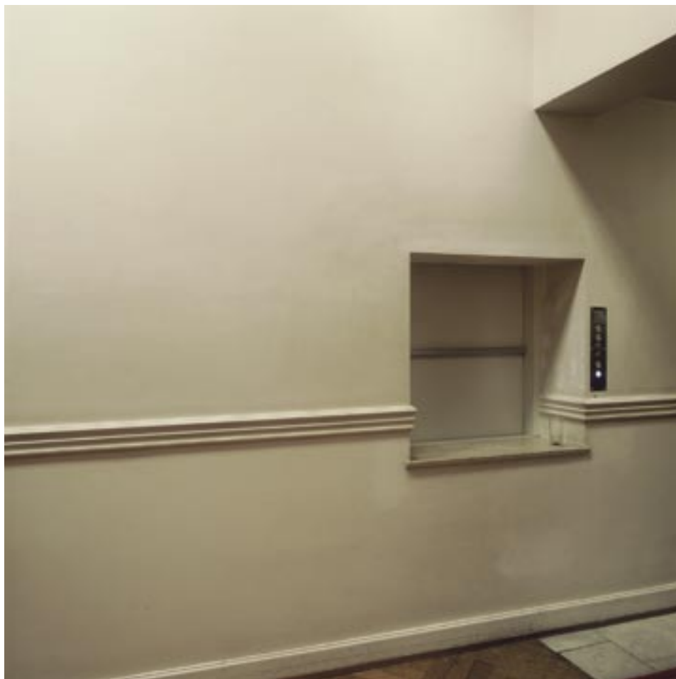
Sénat: couloir Senaat: gang