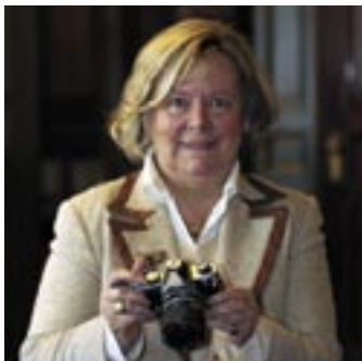
Mevrouw Anne-Marie LIZIN Voorzitter van de Senaat