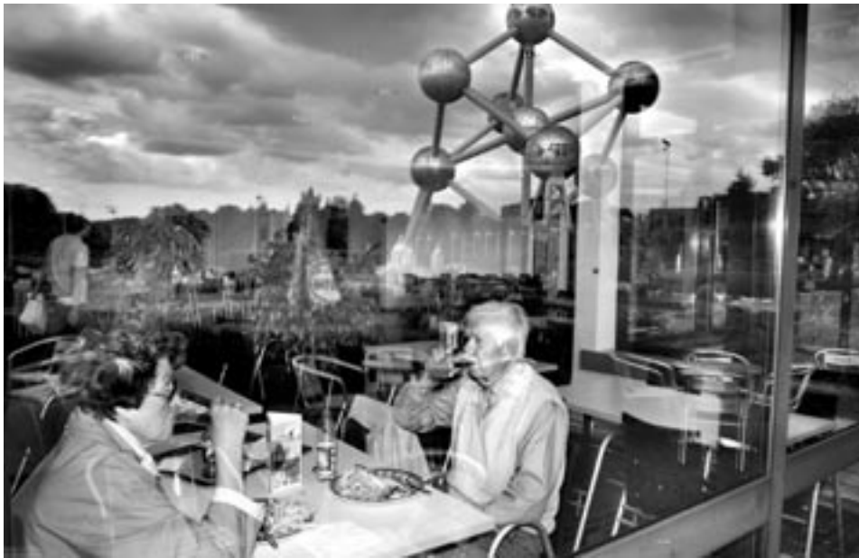
L'Atomium, de la bière et des frites Des visiteurs de l'Atomium consomment de la bière et des frites, à l'ombre du monument lui-même.

Atomium, bier en friet Bezoekers van het Atomium nuttigen bier en friet, in de schaduw van het monument zelf. Thomas VANHAUTE