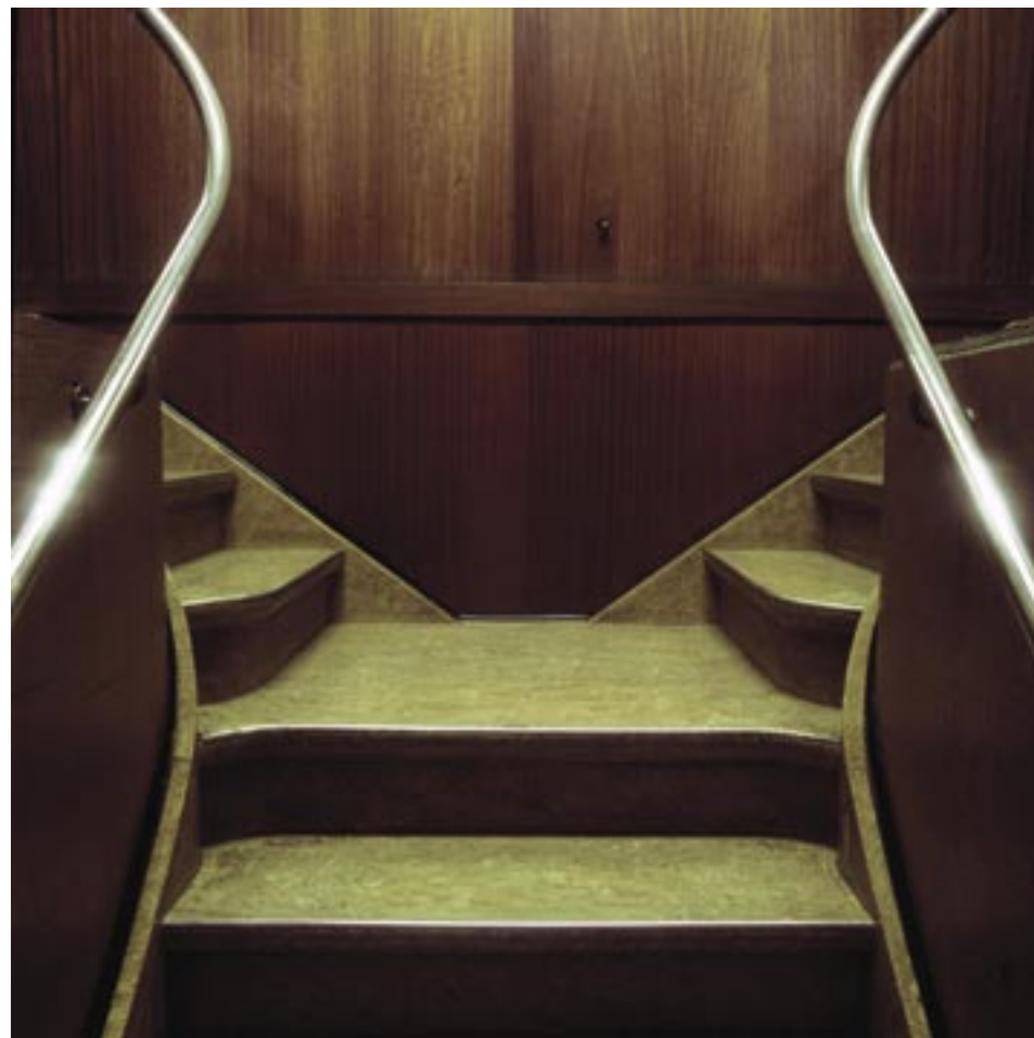
Sénat: escalier Senaat: trap

Clair-obscur - Clair-obscur André Van Nieuwerkerke