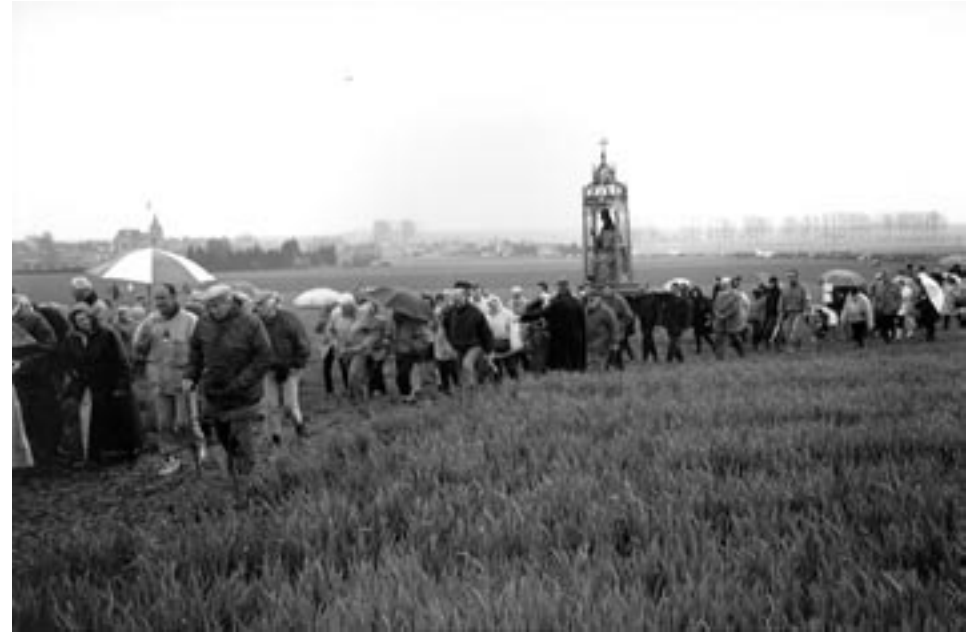
Procession des chevaux, Hakendover, 1995 Paardenprocessie, Hakendover, 1995 Ellen KOK

Ils n'en demandent pas plus - Meer moet dat niet zijn. André Van Nieuwerkerke