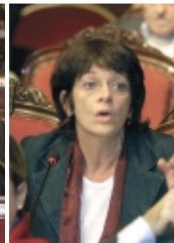
Isabelle Durant (Ecolo) is voor een referendum over de Europese Grondwet.