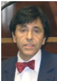
Elio di Rupo (PS) verduidelijkt dat zijn "ja" voor het ontwerp van Europese Grondwet een "strijdbaar ja" is.