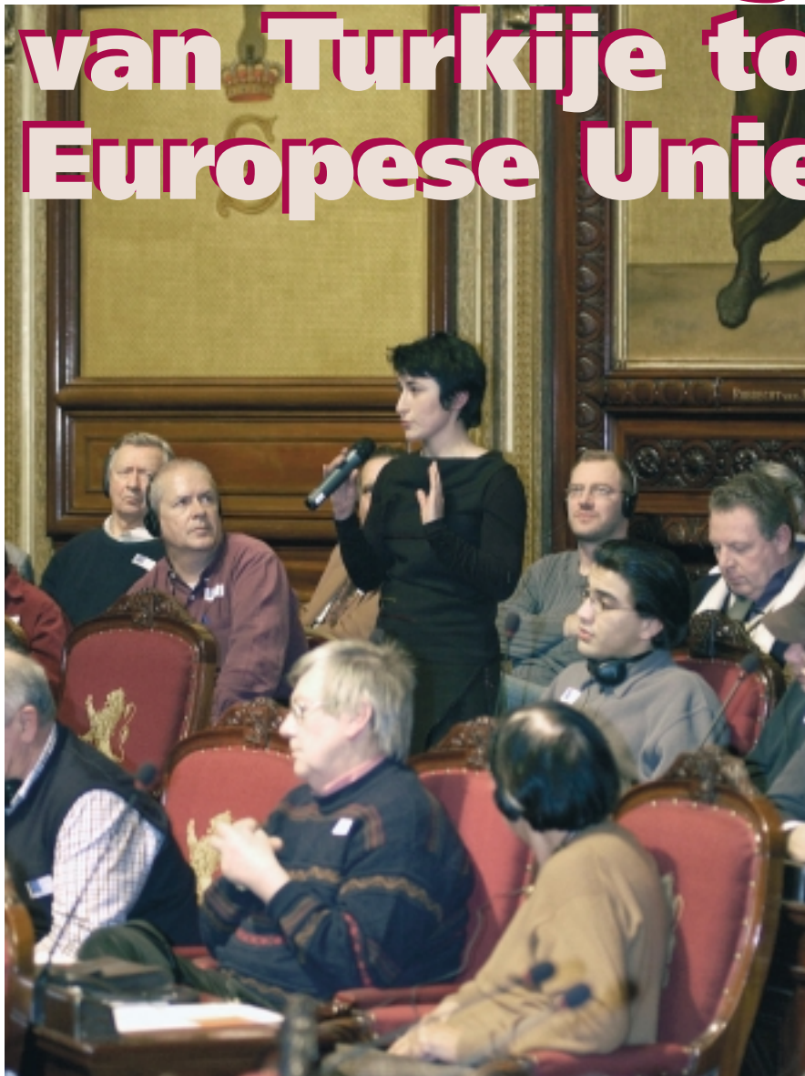
"Moet Turkije niet eerst de Armeense volkerenmoord van 1915 erkennen, vooraleer over toetreding kan worden gesproken?" , vraagt een dame van Armeense origine.

In zijn inleiding stelt minister Karel De Gucht dat de Belgische regering er duidelijk mee heeft ingestemd de onderhandelingen over de toetreding van Turkije tot de Europese Unie snel (halverwege 2005) aan te vatten.