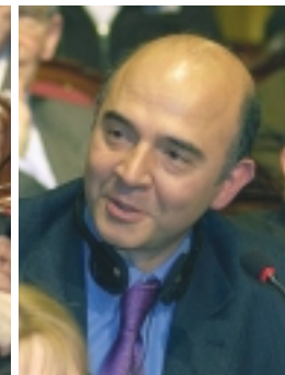
Ook Pierre Moscovici (PS-Frankrijk) erkent de zwakten in de Europese Grondwet.