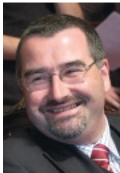
Volgens Karim Van Overmeire (VB) valt de Europese identiteit moeilijk te rijmen met de toetreding van een moslimstaat.