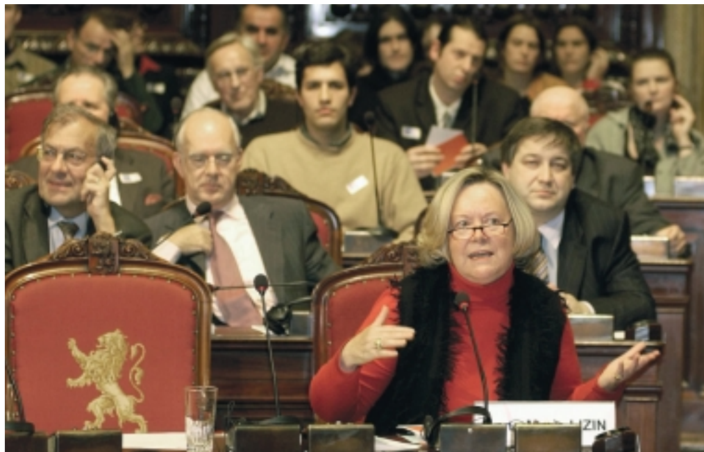
Anne-Marie Lizin : "Dit initiatief is een primeur in de geschiedenis van onze instelling."

Voor de Europese integratie zijn het belangrijke tijden. De recente en toekomstige uitbreiding van de Europese Unie wekt bij de mensen verwachting en hoop. Daarom heb ik, met de medewerking van de senatoren, de deuren van de Senaat opengezet voor de hele Belgische samenleving.