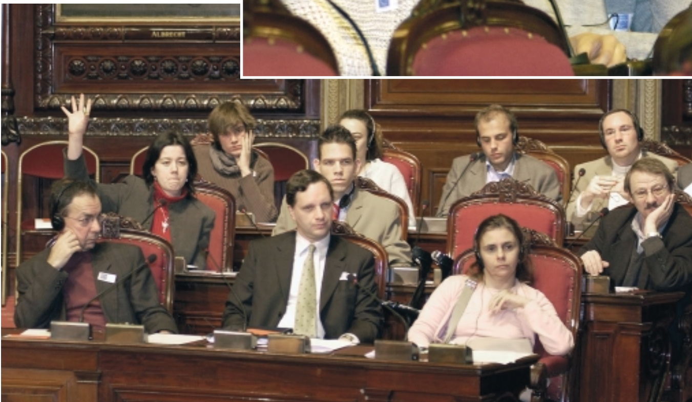
Een stemming onder het publiek maakt duidelijk dat de meerderheid van de aanwezigen vindt dat Europa wel degelijk tekortschiet op sociaal vlak.