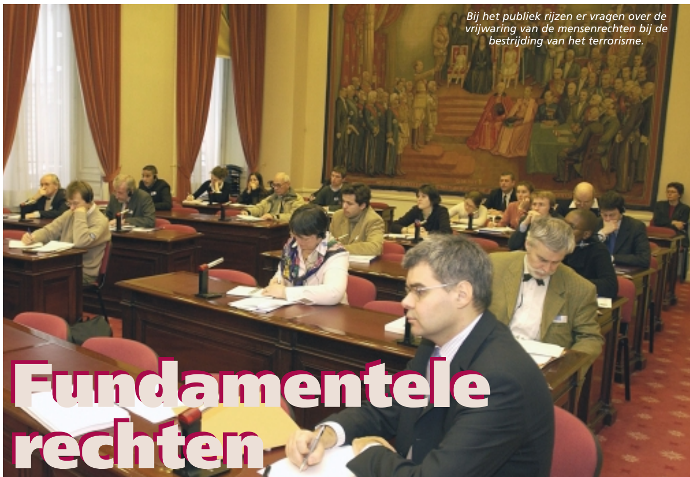
Bij het publiek rijzen er vragen over de vrijwaring van de mensenrechten bij de bestrijding van het terrorisme.