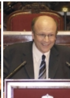
Koen Lenaerts (Europees Hof) is een vurig pleitbezorger van de Europese Grondwet.