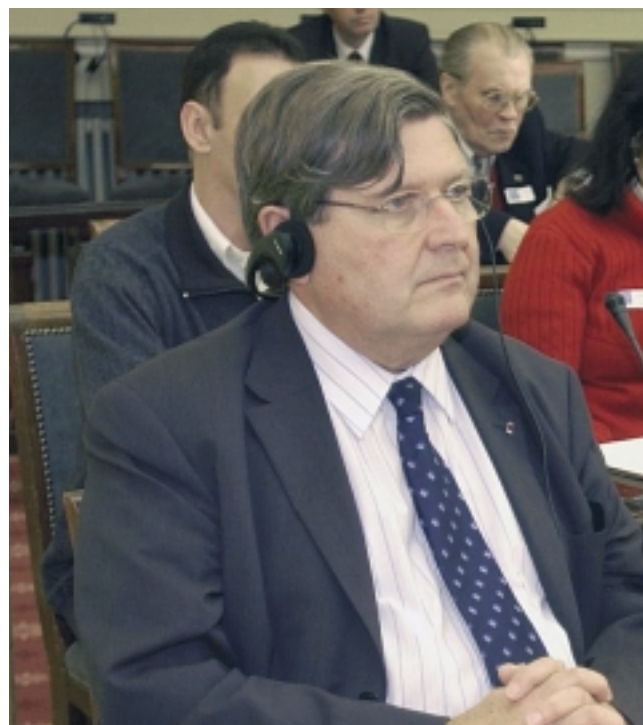
Ook Antoine Duquesne (MR) gelooft dat de Europese Grondwet zal bijdragen tot een efficiëntere bestrijding van de misdaad.

Antoine Duquesne , MR-Europarlementslid, antwoordt hierop dat het Europees parlement een glazen huis is. Deze transparantie biedt de burger de kans om te reageren. De strijd tegen de grensoverschrijdende criminaliteit en het terrorisme zal niet op nationaal vlak worden gewonnen. Dank zij de Europese Grondwet zal deze gemeenschappelijke aanpak het mogelijk maken de georganiseerde criminaliteit doeltreffender te bestrijden, bij voorbeeld door het instellen van het ambt van Europees procureur. ■