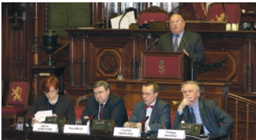
Voor Jean-Luc Dehaene (CD&V) blijft de Europese Grondwet een compromis. Dromen van perfectie leidt volgens de gewezen Premier tot immobilisme.

In juni 2004 hebben de leiders van de 25 lidstaten van de Europese Unie een akkoord bereikt over een nieuwe Grondwet om de EU efficiënter en democratischer te maken. In haar inleiding tot de vergadering spreekt Anne-Marie Lizin de wens uit dat deze Grondwet de vrede en de stabiliteit in Europa zou versterken. De tekst zal slechts in 2006 in werking treden nadat alle lidstaten van de Europese Unie hem hebben geratificeerd. Dit is dus het geschikte moment om de burger aan het woord te laten.