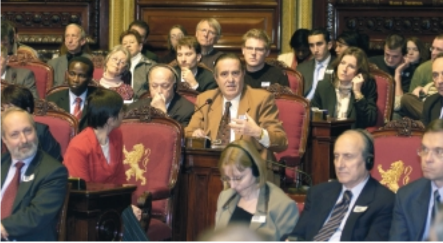
Wel of geen referendum over de Europese Grondwet: de meningen onder het publiek zijn duidelijk verdeeld.